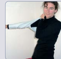
einen Ärmel anziehen